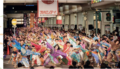
万代シテイでは会場を盛り上げる総踊りを開催!