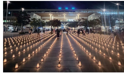
新潟駅では幻想的なキャンドルガーデンが広がります